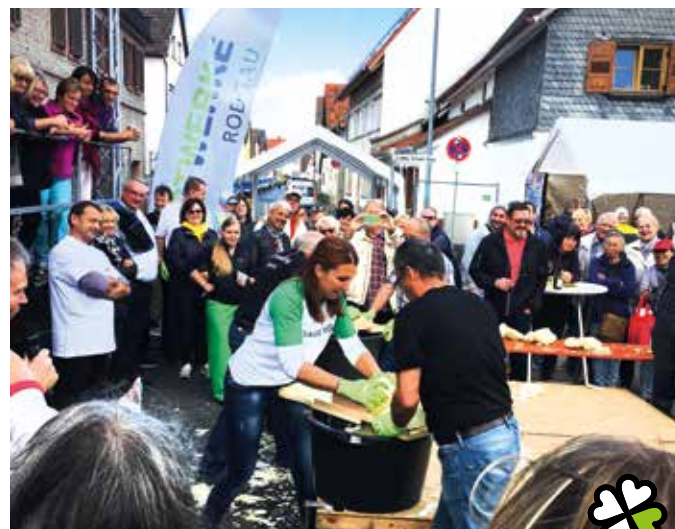
Voll dabei – beim Rodgauer Herbstmarkt und beim Rodgauer Sommer Sonntag

Die Stadt Rodgau kann optimistisch in die Zukunft schauen, die städtischen Herausforderungen stellen auch gehobene Ansprüche an ihre