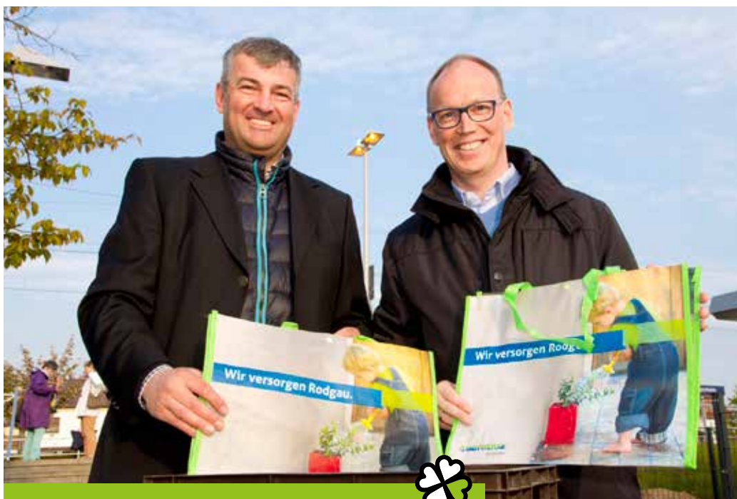
Rosinenbrötchen für Frühaufsteher