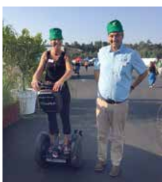
50 Jahre Opel-Testcenter – wir waren dabei